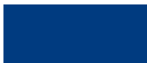
Bleu traffic 466

Les couleurs réelles peuvent être différentes de ce nuancier. Echantillons sur demande à votre représentant.