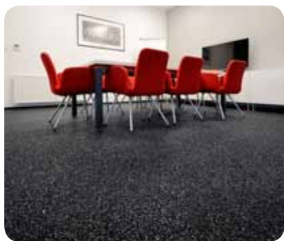
Konferenční sály a haly