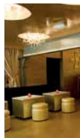
Hotell- och restaurang