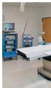
Hälsa- och sjukvård