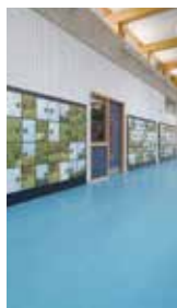
Skolor och kontor